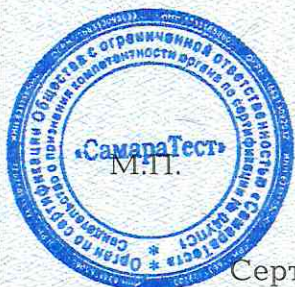
Схема сертификации: 3с.